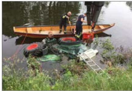
Traktorbergung am Kamp