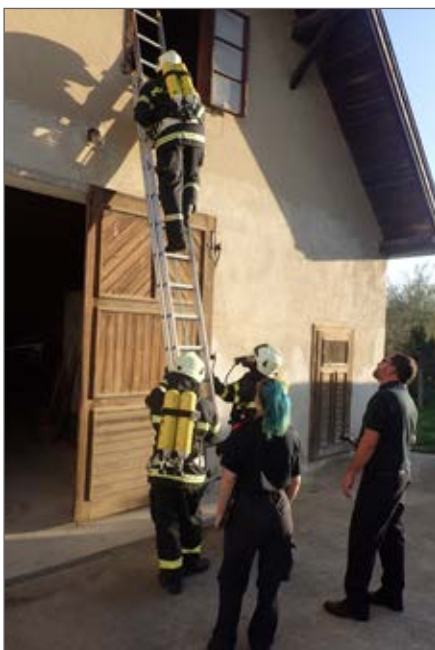
Abschnittsatemschutzübung in Gobelsburg