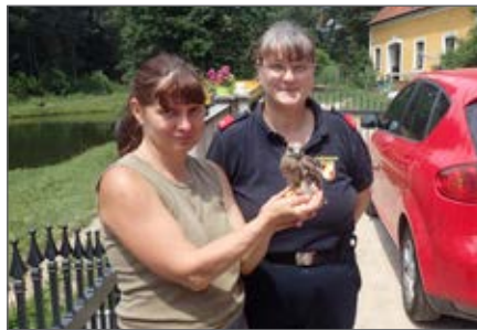
Rettung eines jungen Turmfalken im Mühlweg