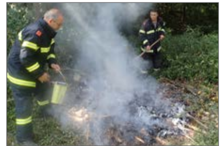
Flurbrand in der Kampau