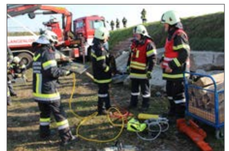
Zugsübung des Katastrophenhilfsdienstes