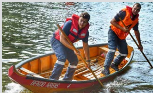
Erfolgreiche Teilnahme am Wasserdienstleistungsbewerb