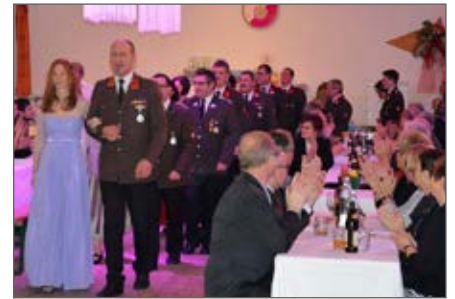
Eröffnung des Dreikönigsballs