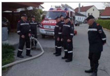
Gruppenübung der 1. Gruppe