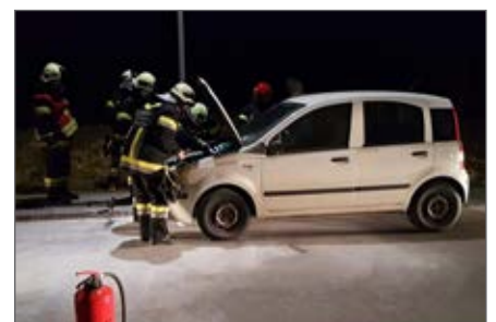
Fahrzeugbrand in der Gobelsburger Straße