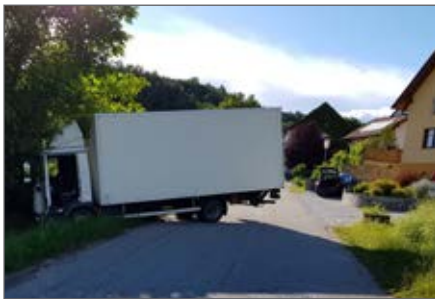
LKW-Bergung in der Eichelbergstraße