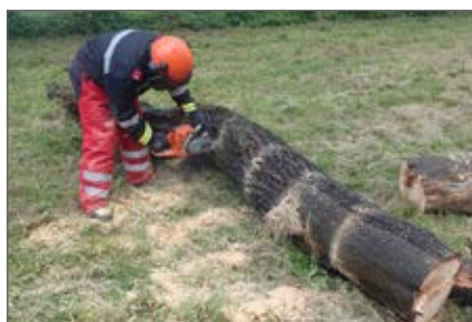
Ausbildung zum Motorsägenführer