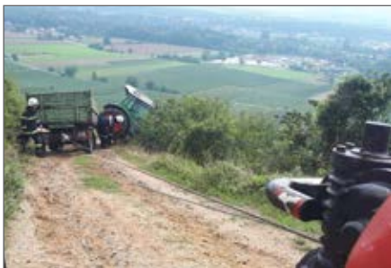
Traktorbergung am Heiligenstein