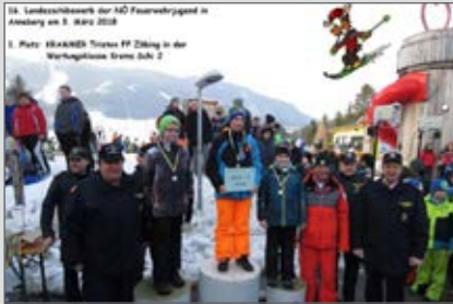
So sehen Sieger aus: 1. Platz beim Landesschibewerb