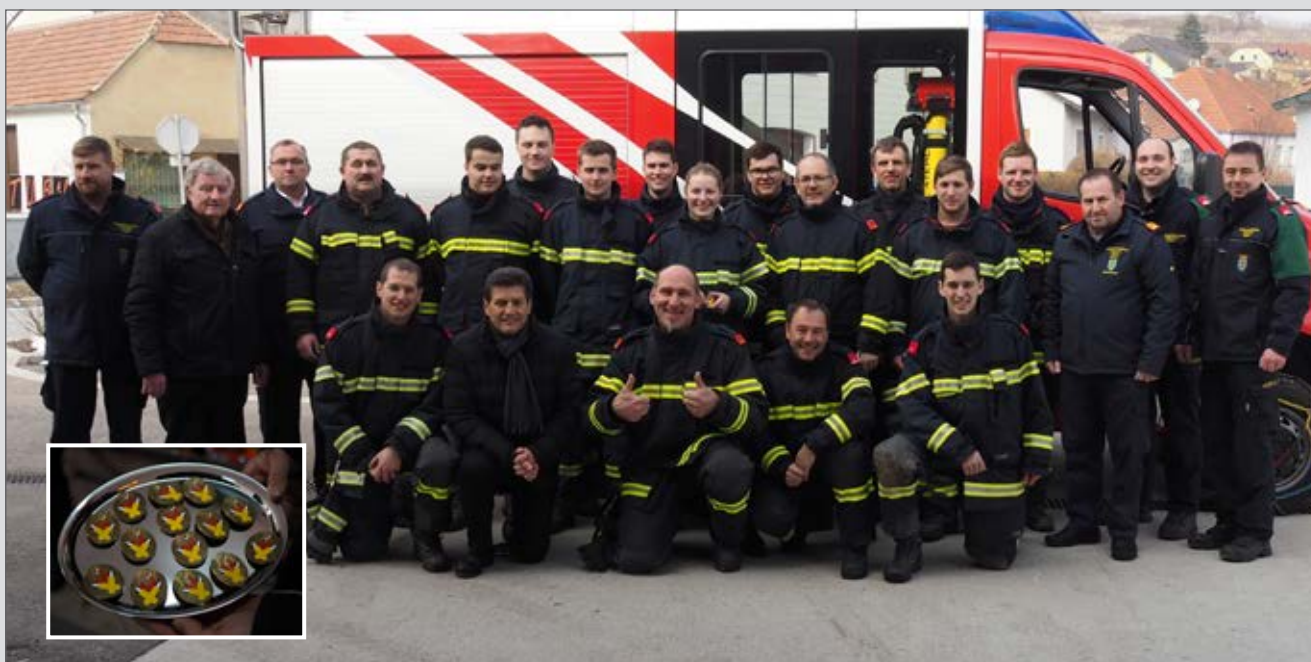
16 Zöbinger Kameraden und Kameradinnen schließen die Ausbildungsprüfung Atemschutz erfolgreich ab.