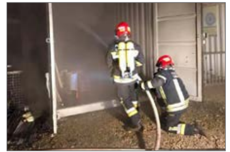
Brandensatz im Gewerbegebiet