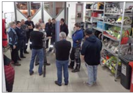
Erweiterte Ausbildung zur Türöffnung