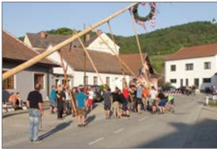
Maibaumaufstellen am Marktplatz