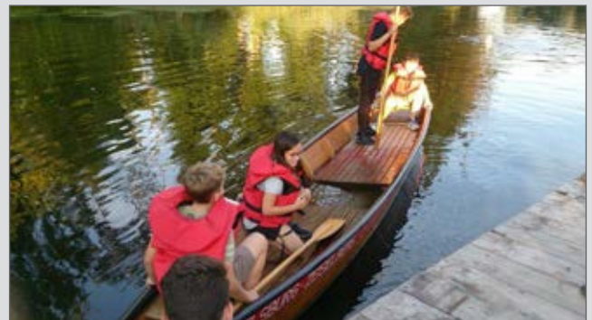
Sommerspaß am Kamp