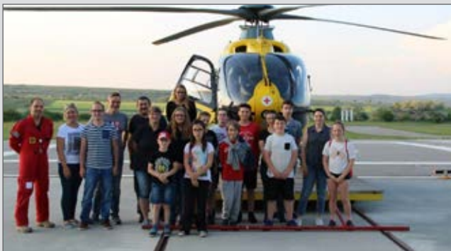
Besuch in Gneixendorf