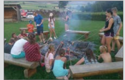
Essenszeit in Altenmarkt

In unserem Betreuer team durften wir ebenfalls mit großer Freude Theresa