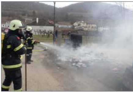
Brandensatz am Friedhofweg