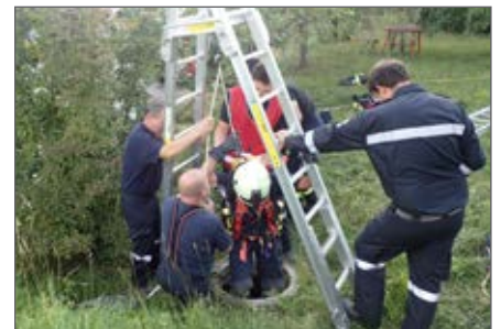
Atemschutzausbildung mit Schachtbergung