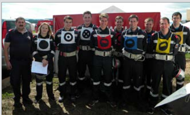
Unsere erfolgreiche Wettkampfgruppe am Landesleistungsbewerb