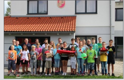
Tolle Projektarbeiten von unseren kleinen Bastlern