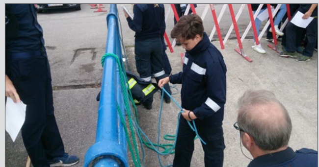
Knotenkunde für das Wasserdienstabzeichen