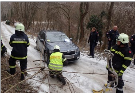
Fahrzeugbergung bei eisglatter Fahrbahn.