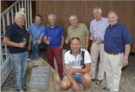
Unsere Harder Freunde wieder zu Besuch in Zöbing.