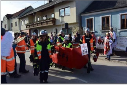
Mit unseren Löschflugzeug durch Zöbing