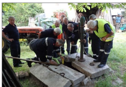
Auch die 1. Gruppe übt noch fleißig.