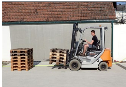
Ausbildung am Hubstapler.