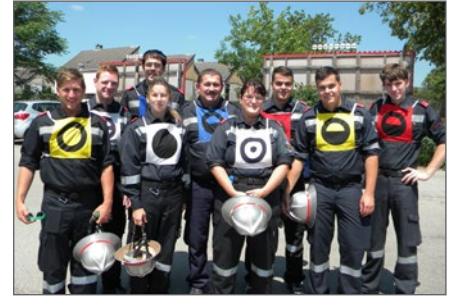
Die Wettkampfgruppe 2017.