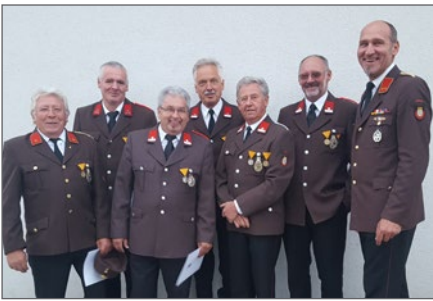
Die Ausgezeichneten beim Abschnittsfeuerwehrtag.