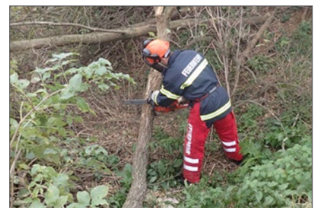
Motosägen-Ausbildung in der Feuerwehr.