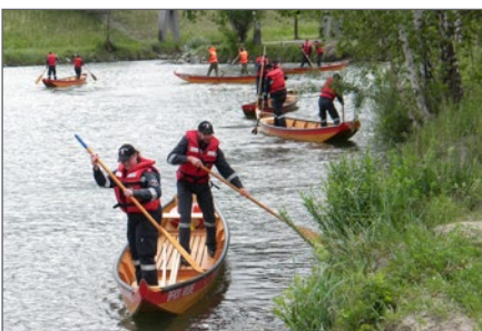
Erstes Ausbildungsmodul im Wasserdienst.