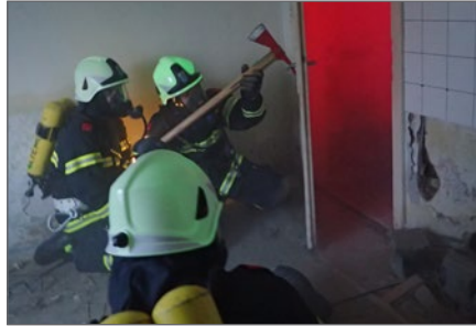
Innenangriff mit schwerem Atemschutz.