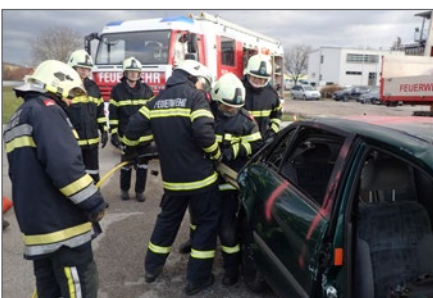
Erstes Training mit dem hydraulischen Rettungsgerät.