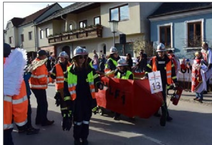
Teilnahme am Faschingsumzug.