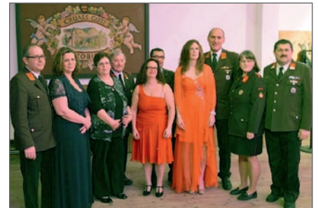
Start in eine gelungene Dreikönigsball-Nacht.