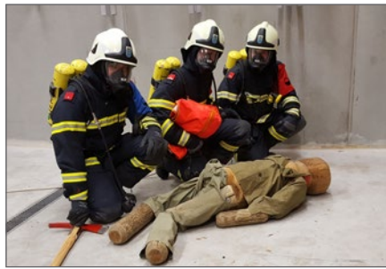
Atemschutzübung mit Personenrettung.