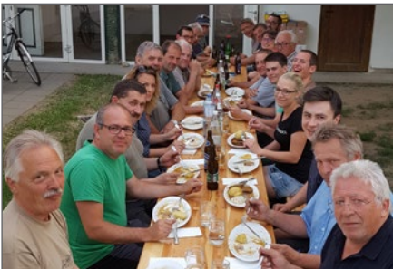
Gemeinsamer Abschluss nach gelungenem Fest.