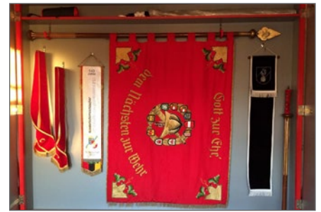
Seit Juni ist der neue Fahnenkasten fertig.