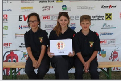
Vor dem Bewerb