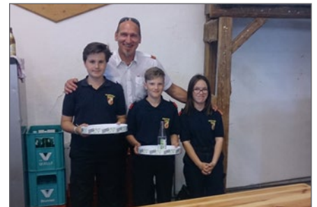
Selbst unsere Jüngsten helfen am FF-Fest mit.