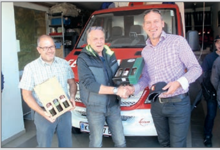
Besuch der FF Stainz