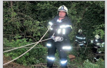
Auch Abseilen will gelernt sein