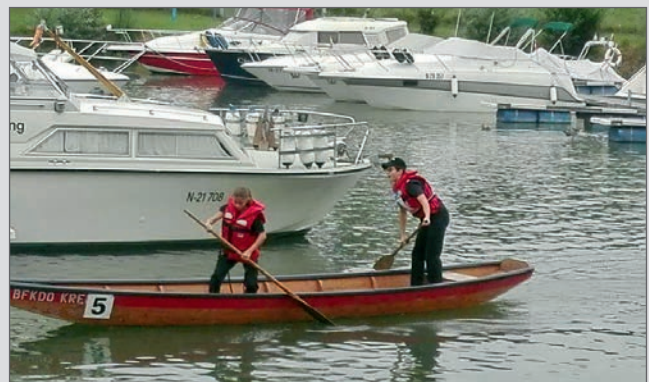
Nachwuchszillenfahrer in Aktion: Fertigungsabzeichen Wasserdienst.