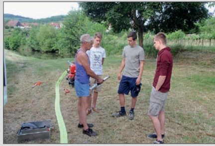
Beginn der Ausbildung unserer 3 „Neuen“