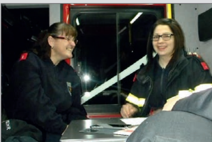
Funkübung in Plank