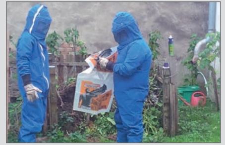
Entfernung von Erdwespen