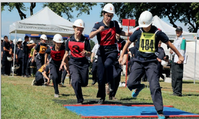
Bewerb um das Feuerwehrjugendleistungsabzeichen in Wolfsbach.