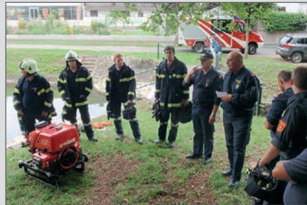
Unsere neuen Einsatzmaschinenisten