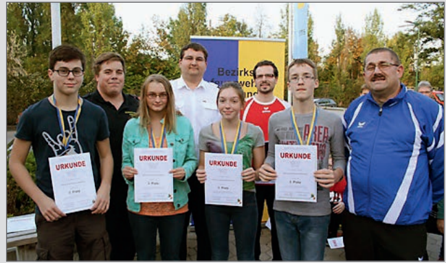
Hervorragende Leistung der Feuerwehrjugend bei Schwimmvergleichsbewerb.