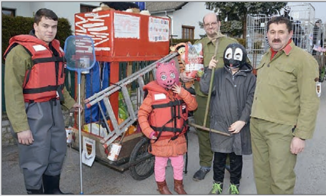
Tierrettungstrupp im Einsatz: da fühlen sich sogar die Schweine sicher.