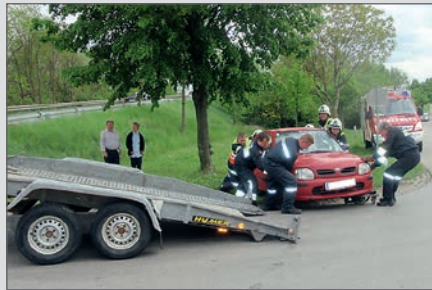
Verkehrsunfall auf der B34