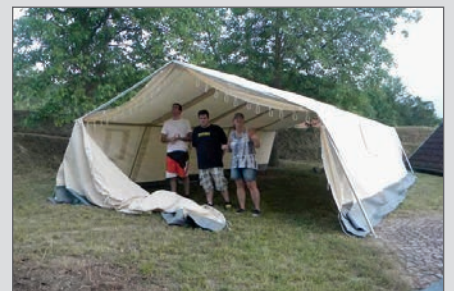
Erster Aufbau des neue Katastrophenzeltes