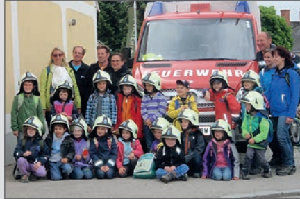
Besuch der Volksschulkinder