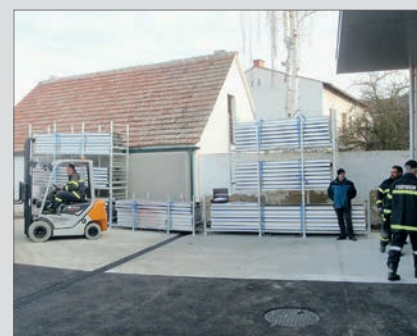
28. Dezember 2015: Einlagern der mobilen Hochwasserschutzzelemente.