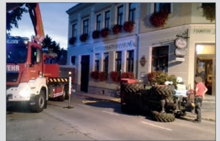
Bergung eines umgestürzten Traktors