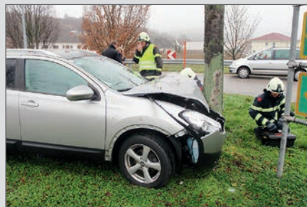
Fahrzeugbergung auf der B34