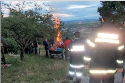
Brandsicherheitswache bei der Sonnwendfeier