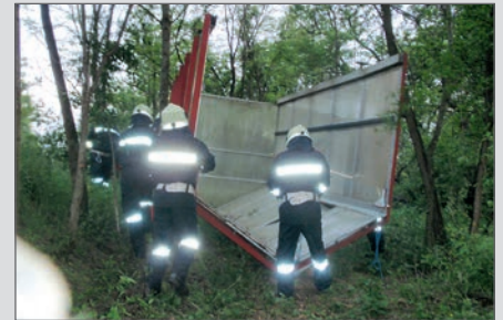
Beseitigung eines Sturmschadens