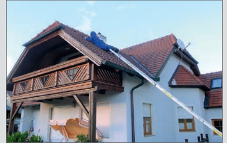
Hornissennestentfernung am Silberörtl