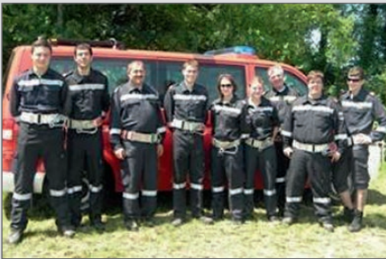
Die Wettkampfgruppe beim Landesleistungsbewerb