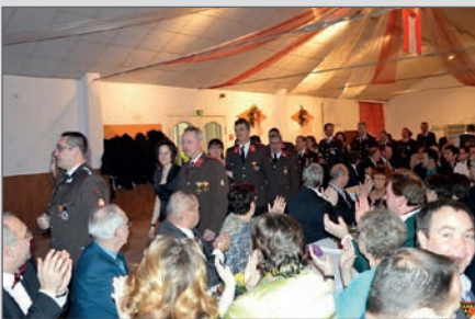
Einmarsch beim Dreikönigsball