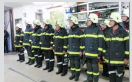
Angetreten zur Großen Inspektion.