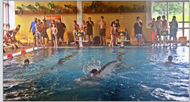
„Wasserratten“ in Aktion beim Schwimmbewerb in Krems

Schlierenzauer, Diethart und Iraschko-Stolz. Ein Besuchertag mit Vorführungen vom NÖ Zivilschutzverband, des Bundesheeres und von verschiedenen Feuerwehrausstattungsfirmen rundete das Angebot ab.