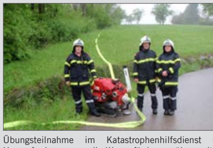
Übungsteilnahme im Katastrophenhilfsdienst – Herausforderung war die Wasserförderung über weite Strecken.