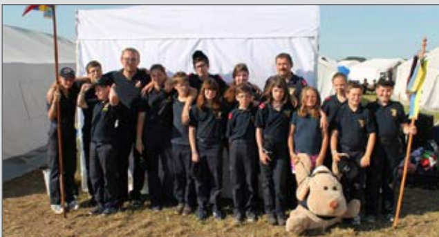
Gelebte Kameradschaft beim Landestreffen

Der Höhepunkt jedes Jahres ist die Teilnahme am Landestreffen. Bei Zeltlagerromantik und einen tollen Freizeitangebot verbrachten wir vier wunderschöne Tage im Bezirk Gänserndorf. Solche Veranstaltungen sind eine sehr gute Gelegenheit zum Knüpfen von Freundschaften mit anderen Jugendgruppen, sowie zum Erlernen von Disziplin in einer Gemeinschaft (bei ca 4500 Teilnehmern ist das Einhalten von Regeln unbedingt erforderlich). Die Highlights dieser Tage waren die Teilnahme an den Feuerwehrjugendleistungsbewerben und eine Autogrammstunde mit unseren ÖSV Adlern