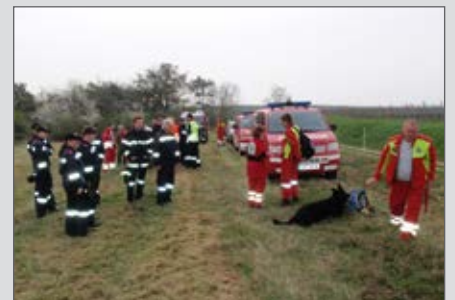
Großeinsatz zur Personensuche.