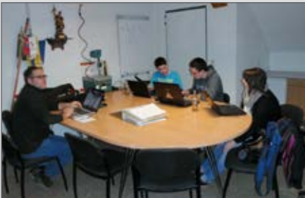
Die Arbeitsgruppe „Homepage“ tagt.