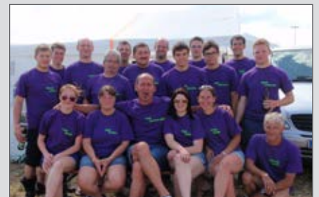
Die Zöbinger Wettkampfgruppen am Landesleistungswettbewerb in Retz.