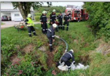
Gruppenübung der 2. Gruppe.