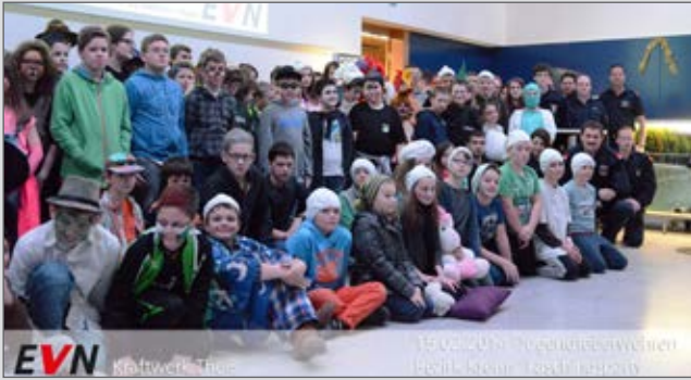
Heiteres Faschingsstreben im Kraftwerk Theiß