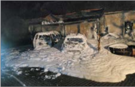
Brandeinsatz in Langenlois.