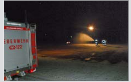
Leider erfolgloser Versuch zur Eisherstellung am Zöbinger Eislaufplatz.