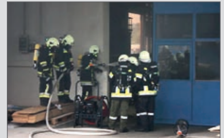
Brandeinsatz in der Stahlbaufirma Renner.