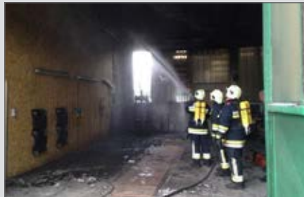
Brandeinsatz am Bauhof Langenlois.