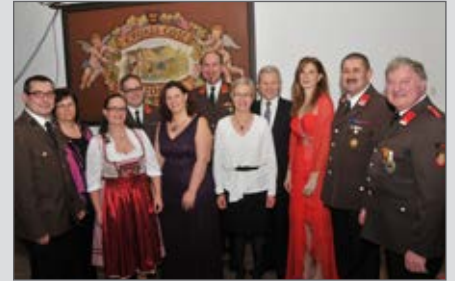
Volles Haus beim Dreikönigsball.