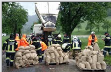
Mit dem Katastrophenhilfsdienst im Einsatz in Schrambach.