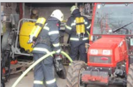
Atemschutzübung in einem Landwirtschaftsgebäude.