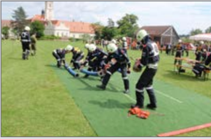
Feuerwehrleistungsbewerb im Garten des Stiftes Altenburg.