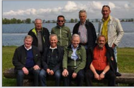
Mit einem Besuch im Frühjahr 2014 wurde die Freundschaft mit der Stadt Hard gepflegt.