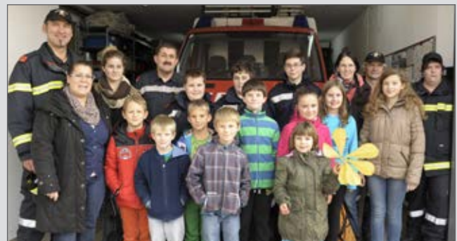
Erlebnistag für die kath. Jungschar bei der FF Zöbing