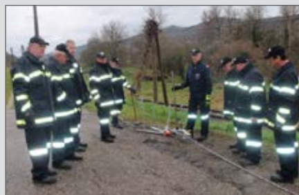
Einschulung der 1. Gruppe auf den neuen Greifzug.