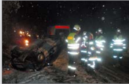
Verkehrsunfall auf der B34.