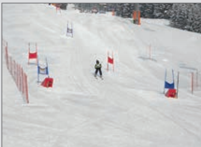
11. Landesschibewerb in Annaberg