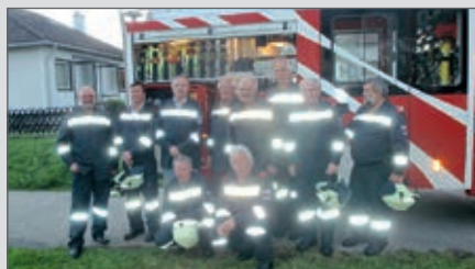
Unsere „Elitegruppe“ in voller Mannschaftsstärke