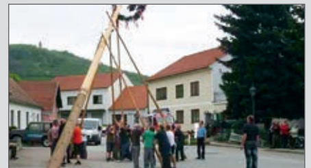
Maibaumaufstellen am Marktplatz