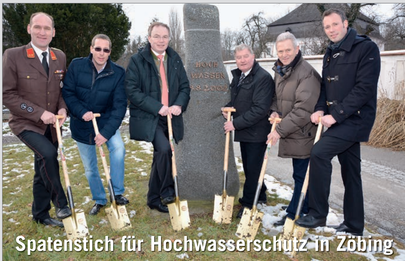
Spatenstich für Hochwasserschutz in Zöbing