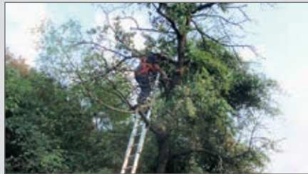
Baum drohte zu stürzen