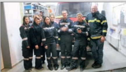
Wir freuen uns über 7 neue Funker in unserer Wehr