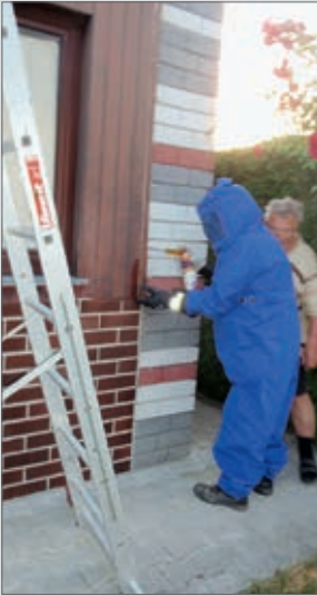
Wespen beschäftigten uns den ganzen Sommer