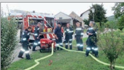
Branddienst-Ausbildung der 2. Gruppe