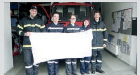
Weißer Fahne für unsere 5 neuen „Truppmänner“