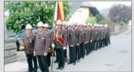
Stolze Ausrückung zur Floriani-Messe