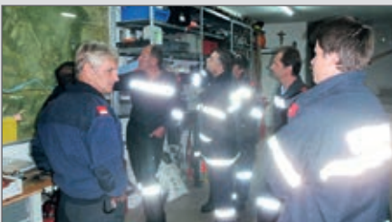
Planspiel mit unseren Einsatzleitern