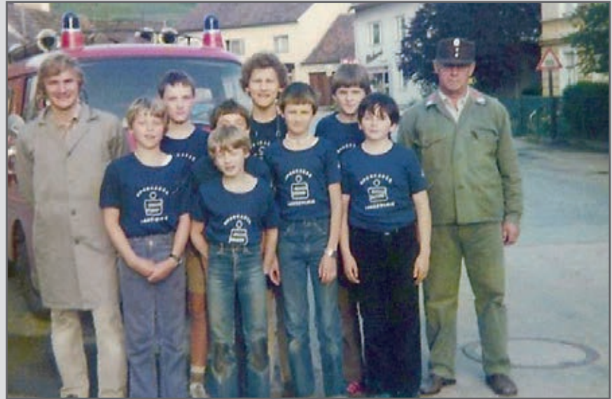
Vor 30 Jahren: Startschuss für die Feuerwehrjugend Zöbing

Im Jahr 2013 feierte unsere Feuerwehrjugend ihr 30-jähriges Bestehen. Was anfangs mit weniger Ausstattung, aber dafür größter Motivation begann, entwickelte sich schnell zu einem Riesenerfolg, welcher die Entwicklung der FF Zöbing nachhaltig mitprägte. Das gesamte heutige Kommando und ein überwiegender Teil der Sachbearbeiter und Mannschaftsmitglieder begannen ihre Feuerwehrkarriere in der Feuerwehrjugend. So gesehen war die Feuerwehrjugend in den letzten Jahrzehnten maßgeblich an der Ausbildung junger Feuerwehrmitglieder mitverantwortlich, welche heute für den Nächsten in Not, ihr Wissen und Können unentgeltlich in ihrer Freizeit zur Verfügung stellen.