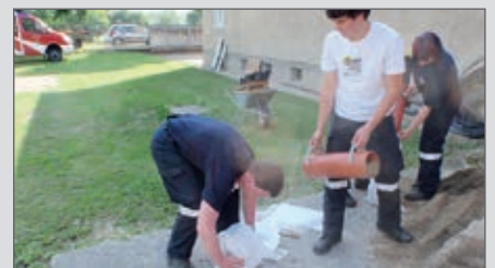
Auch Hochwasserschutz soll gelernt sein