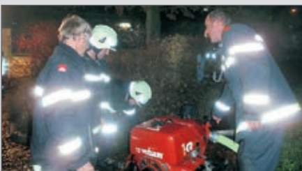
Unterabschnittsübung in Langenlois