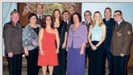
Die Eröffnung des Feuerwehrballes 2013