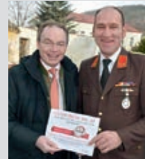
LR Pernkopf überraschte mit einem Biergutschein