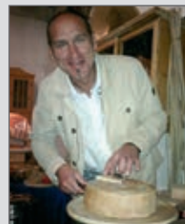
Käse in Hard erzeugt und in Zöbing verkostet