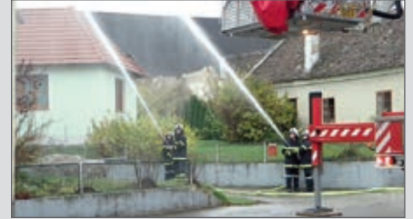
Abschnittsübung in Gobelsburg