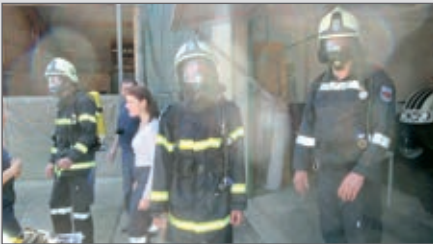
Atemschutzausbildung unserer Jüngsten