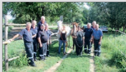
Sowohl die 1. Gruppe als auch die 2. Gruppe übten den sicheren Umgang mit Tieren