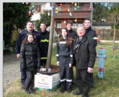
Eine nette Sache: Osterbaum 2012

Den Abschluss bildete wie jedes Jahr die Abnahme der Erprobung. Diese ist die Grundlage für die Beförderungen in der FF-Jugend. Danach ließen wir das Jahr 2012 mit einer kleinen Jahresabschlussfeier ausklingen