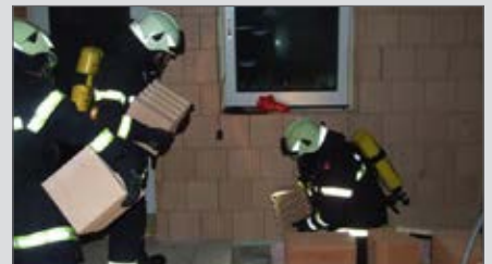
Atemschutzausbildung unter Belastung