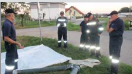
Ausbildung in der 1. Gruppe