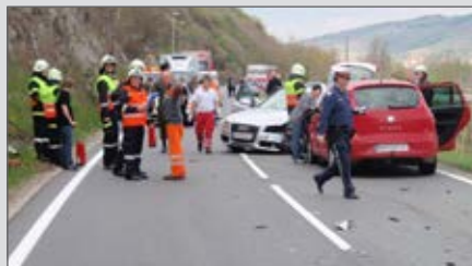
Verkehrsunfall auf der B34