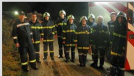
Unterabschnittsübung in Lengelfeld