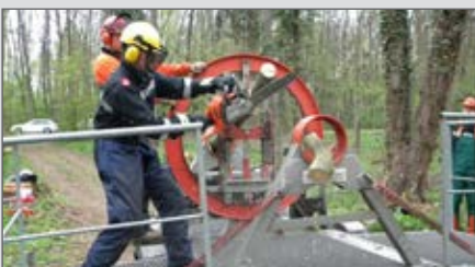
13 erweitert ausgebildete Motorsägenführer