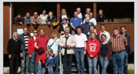
Besuch der Feuerwehren der Stadtgemeinde Hard