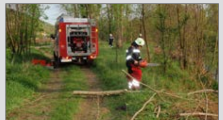
Übung der 1. Gruppe