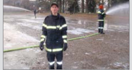
Wenn's kalt wird, beginnt die FF mit dem Aufspritzen