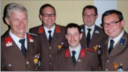
Die Ausgezeichneten vom Abschnittsfeuerwehrtag