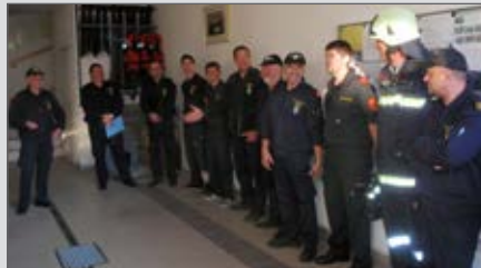
Abnahme der großen Inspektion