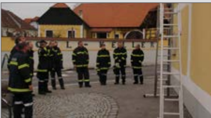
Übung 2. Gruppe: richtiges Arbeiten mit Leitern