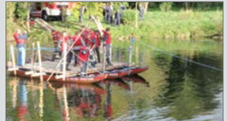
In der KHD-Ausbildung wurde Fährenbau geschult