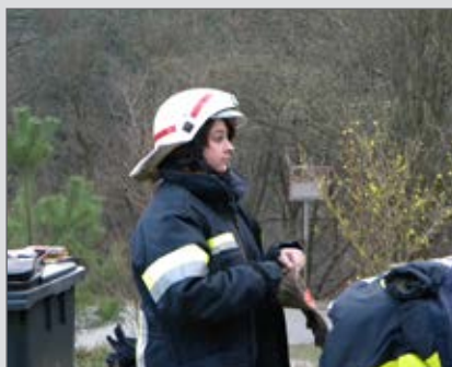
Handhabung der Kleinlöschgeräte

Auf Betreiben unseres Ortsvorstehers wurde vor einigen Jahren der Brauch ins Leben gerufen, einen Osterbaum aufzustellen. 2012 hatte die Feuerwehrjugend in Zusammenarbeit mit Mitgliedern der 5. Gruppe die Ehre