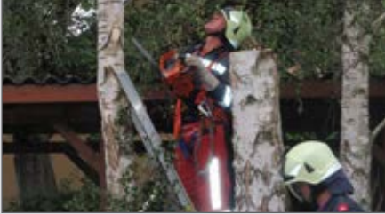
Gefährliche Bäume werden entfernt