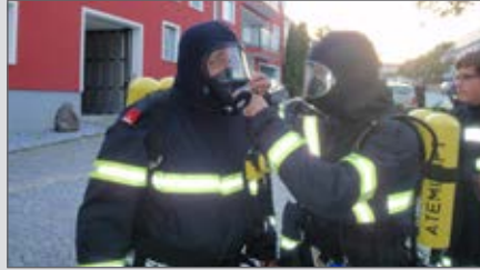
Atemschutzübung in Mittelberg