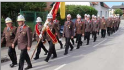
Kirchgang zur Florianimesse