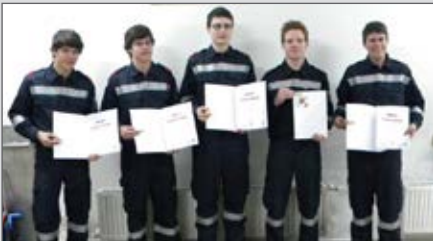
5 bestandene Funkleistungsabzeichen in Gold