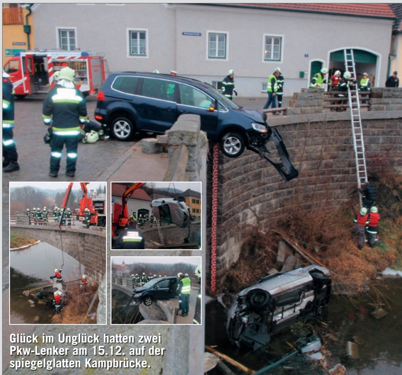
Glück im Unglück hatten zwei Pkw-Lenker am 15.12. auf der spiegelglatten Kampbrücke.