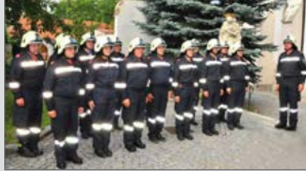
Teilnahme an der 10-Jahres-Hochwassergedenkfeier