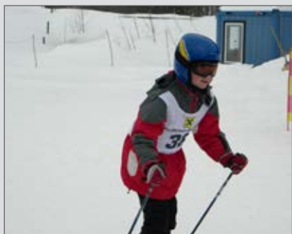
10. Landsschibewerb in Annaberg