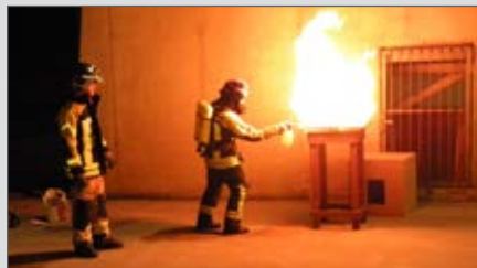
Simulation von Flashover und Backdraft