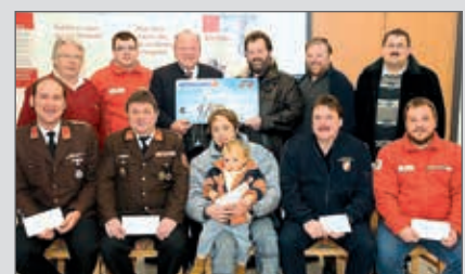
Am 20. Dezember übergab die SPÖ Langenlois u. a. auch der FF Zöbing eine namhafte Spende.