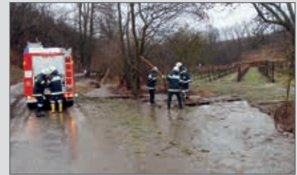
Wieder einmal Hochwassereinsatz: am 6. März trat der Fahnbach in der Reithstraße über die Ufer.