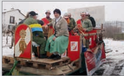
Auch Spass muss sein: die FF Zöbing durfte beim Faschingsumzug im Jänner nicht fehlen.