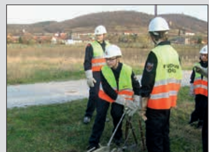
Auch der Umgang mit techn. Gerät muss gelernt werden (Handhabung des Greifzuges)