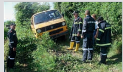
Am 5. September musste ein VW-Bus geborgen werden.