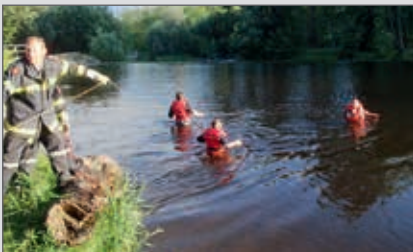
Am 28. Mai fand eine Übung der 3. Gruppe mit den neuen Wathosen und Schwimmwesten statt.