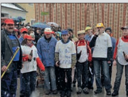
Ein „Echter Wiener“ geht nicht unter! „Jung-mundln“ beim Zöbinger Faschingumzug