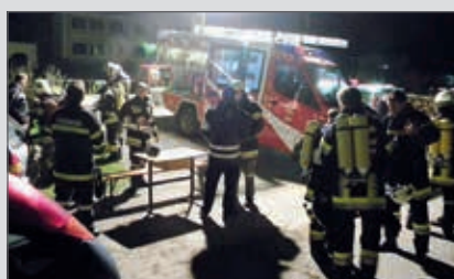
Atemschutzübung in Zöbing im Rathauskeller am 23. Oktober: der Übungsablauf wird abgesprochen.