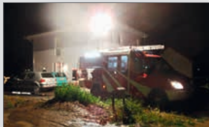
Mit Tauchpumpe und Schaufeln wurde am 22. Juni ein Haus von Wasser und Schlamm befreit