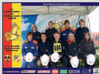
Bewerbsgruppe Zöbing-Pilsach-Karlstetten beim Gruppenbewerb Silber