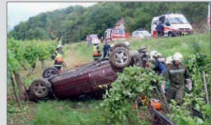
Am 15. Juni stürzte ein Pkw über eine Böschung an der B34, die FF Zöbing musste bergen.