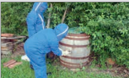
Auch das ist Feuerwehrarbeit: Entfernung eines Hornisnennestes am 5. August.