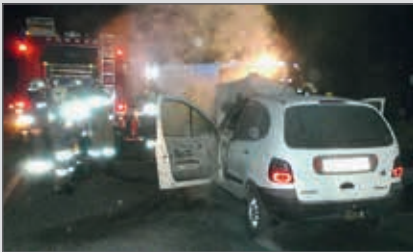
Brandereinsatz am 5. Mai: ein Pkw am Parkplatz Schönberger Straße (B34) musste gelöscht werden.