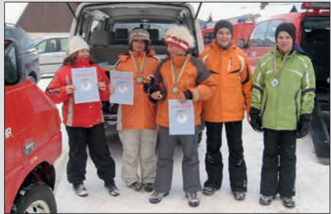
Unsere erfolgreichen Schifahrer