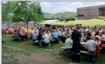
Tolle Stimmung und guter Besuch beim alljährlich stattfindenden FF-Fest im Mai.