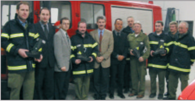
26.2.03: Übergabe von 14 Paar Stiefeln (Rukapol) und 14 Jacken der (Textport)