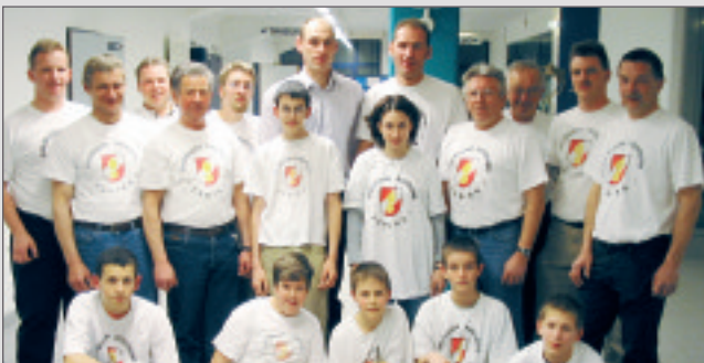
22.03.03: Einladung des UHK Krems zum Spiel Krems gegen Stockerau