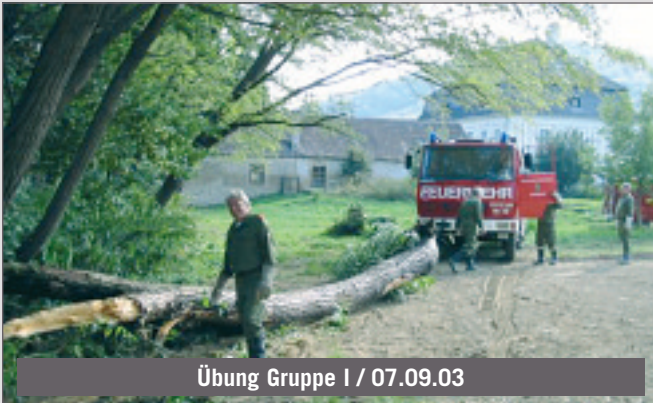
Übung Gruppe I / 07.09.03