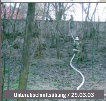
Unterabschnittsübung / 29.03.03