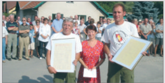
Spende und Dankesurkunden der Ortschaft an die Feuerwehr