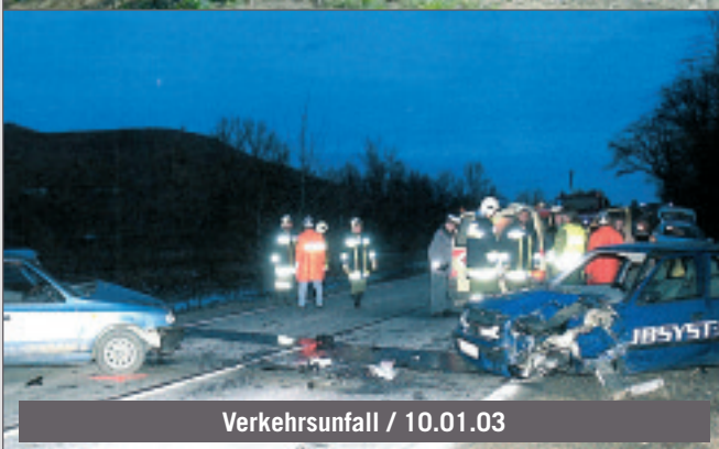
Verkehrsunfall / 10.01.03