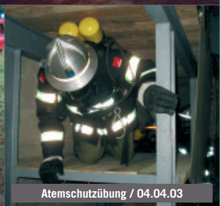
Atemschutzübung / 04.04.03