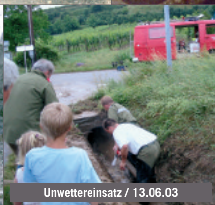
Unwettereinsatz / 13.06.03