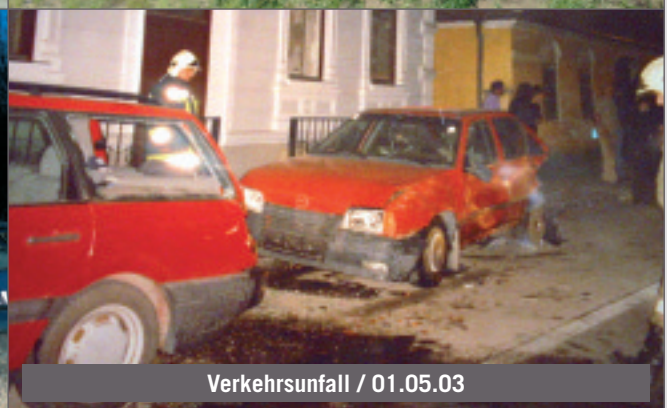
Verkehrsunfall / 01.05.03