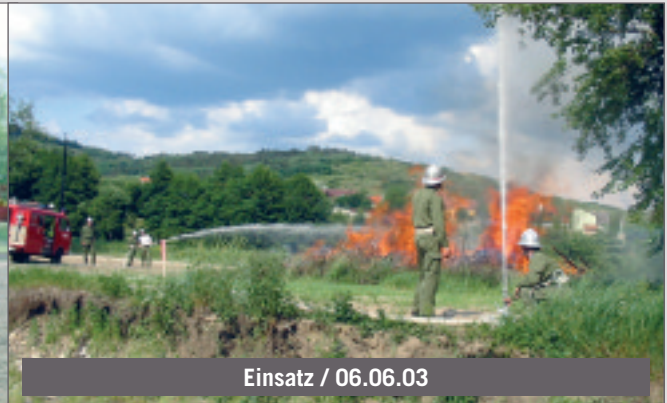
Einsatz / 06.06.03